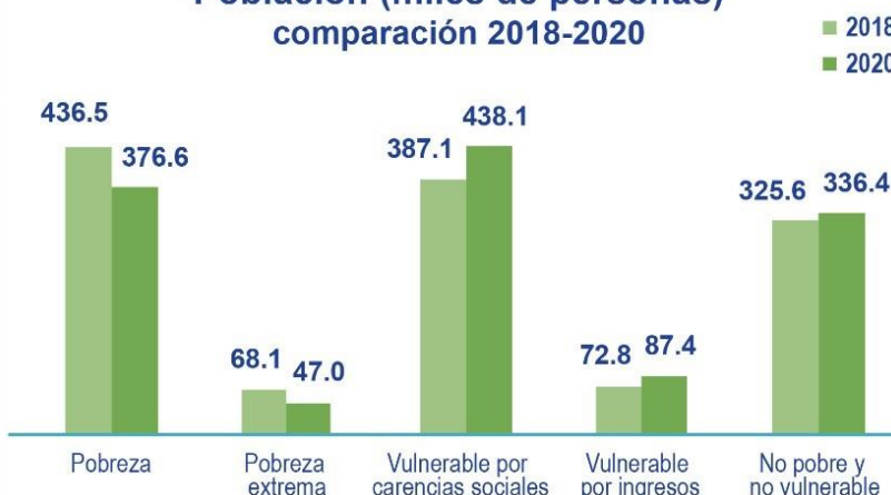
Población (miles de personas) comparación 2018-2020