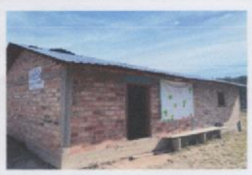
Ilustración 4 ESCUELA PREESCOLAR