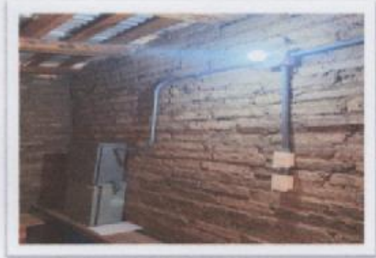
Ilustración 1 PANELES SOLARES