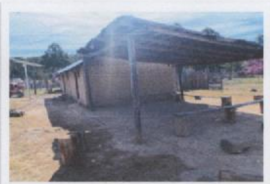
Ilustración 3 CASA DE SALUD