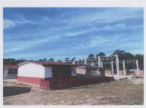
Ilustración 6 ESCUELA PRIMARIA