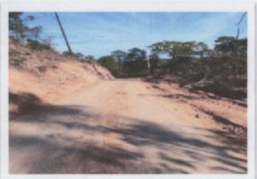
Ilustración 5 CAMINO-BRECHA