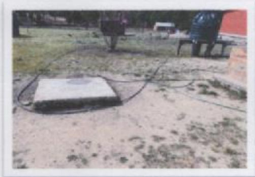
Ilustración 2 AGUA POTABLE