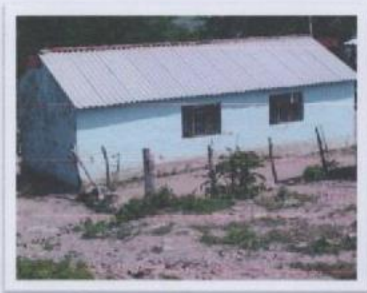
Ilustración 2 ESCUELA PRIMARIA CONAFE