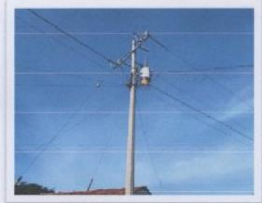
Ilustración 1 LUZ ELECTRICA