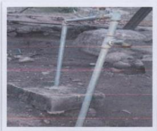
Ilustración 4 AGUA POTABLE