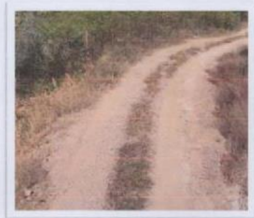
Ilustración 3 BRECHA