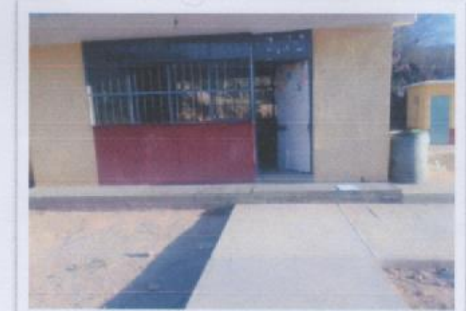
Ilustración 5 ESCUELA PREESCOLAR CONAFE