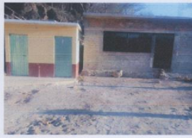
Ilustración 6 ESCUELA SECUNDARIA CONAFE