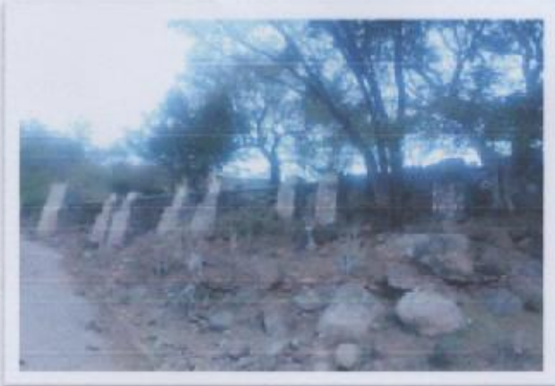
Ilustración 2 DRENAJE