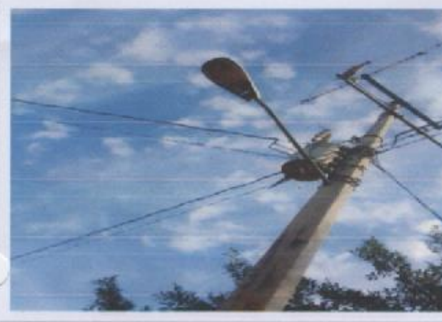
Ilustración 4 LUZ ELECTRICA