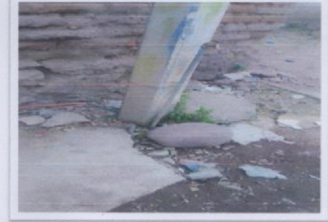
Ilustración 3 AGUA POTABLE