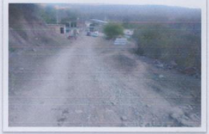
Ilustración 1 BRECHA