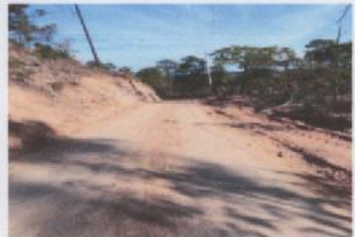
Ilustración 5 CAMINO-BRECHA