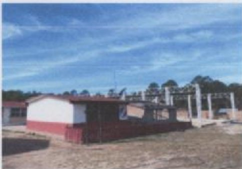
Ilustración 6 ESCUELA PRIMARIA