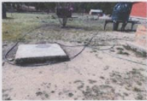
Ilustración 2 AGUA POTABLE