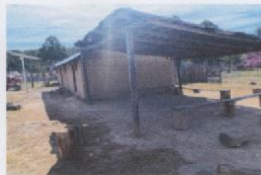
Ilustración 3 CASA DE SALUD