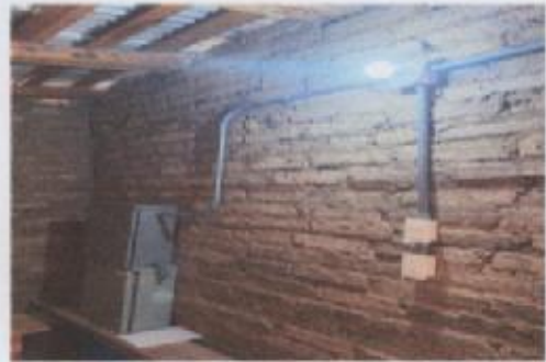
Ilustración 1 PANELES SOLARES