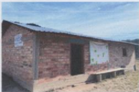
Ilustración 4 ESCUELA PREESCOLAR