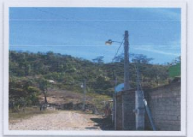
Ilustración 5 LUZ ELECTRICA