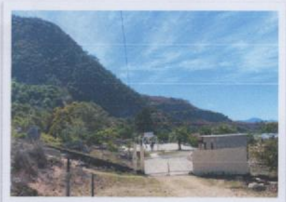
Ilustración 4 ESCUELA PRIMARIA