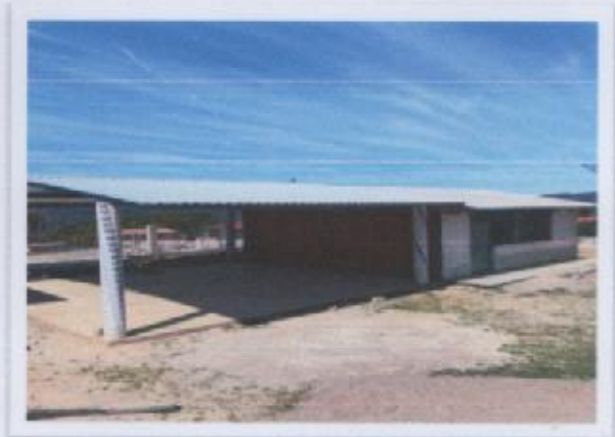
Ilustración 1 ESCUELA SECUNDARIA CONAFE