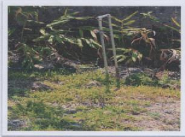
Ilustración 2 AGUA POTABLE