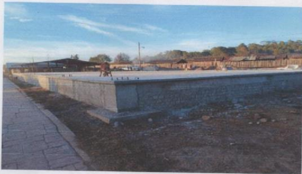
FIGURA 2.- VERIFICACION DE AVANCE DE OBRA EN LA LOCALIDAD DE GUACAMAYAS