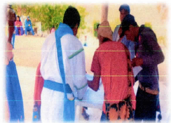
Ilustración 1 Firma de Acta de asistencia