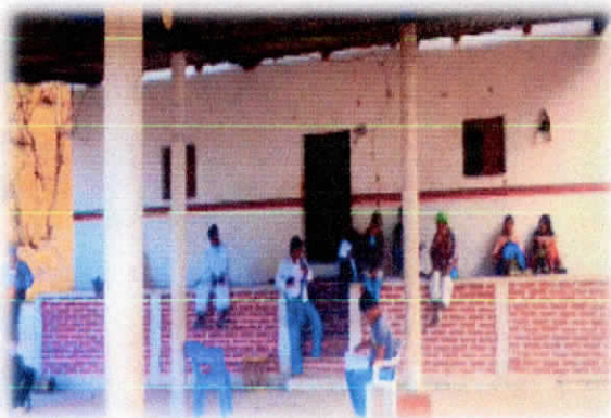
Ilustración 4 Mi participación en la reunión