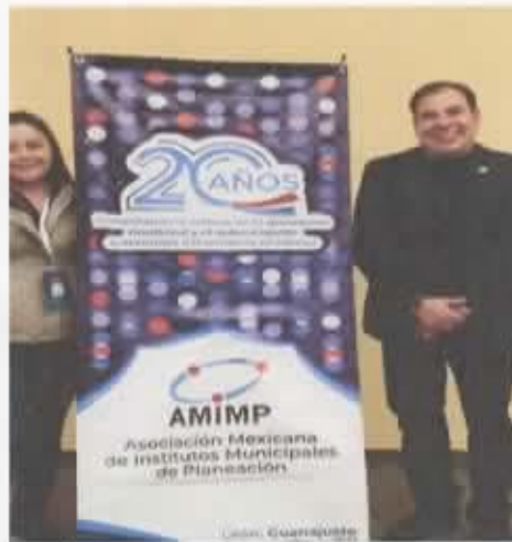
FIGURA 1.- Semana Internacional Planeación-Arquitectura-Espacio Público