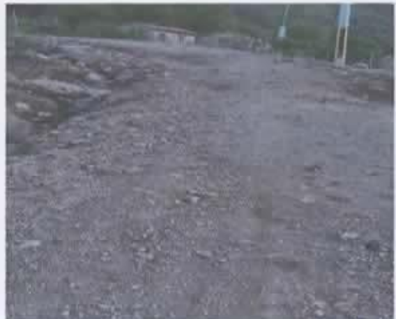
Ilustración 5 Brecha