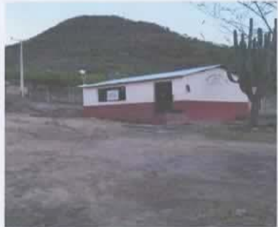
Ilustración 3 Escuela conafe