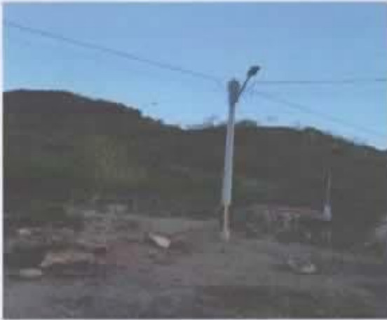
Ilustración 2 Luz eléctrica