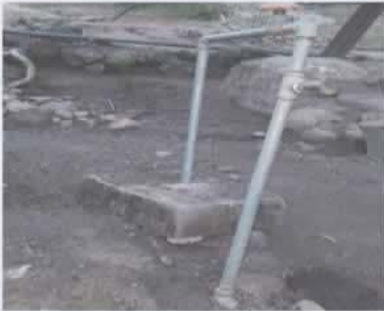
Ilustración 4 Agua potable