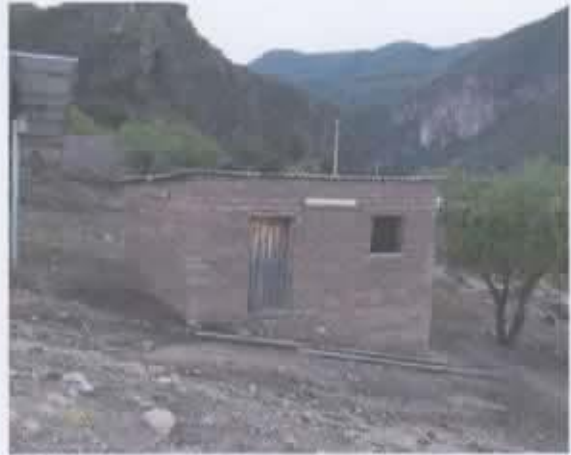
Ilustración 1 Casa auxiliar