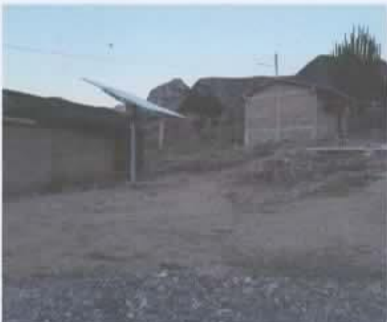
Ilustración 6 Escuela Primaria