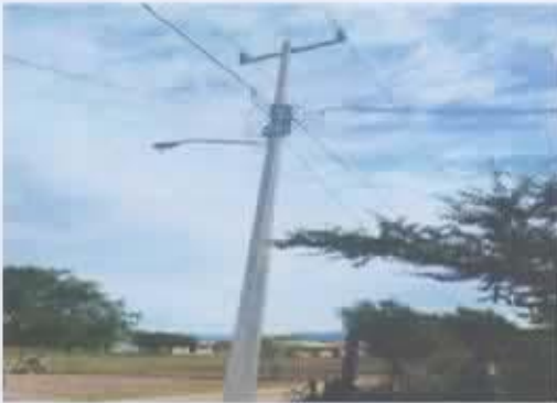
Ilustración 3 LUZ ELECTRICA