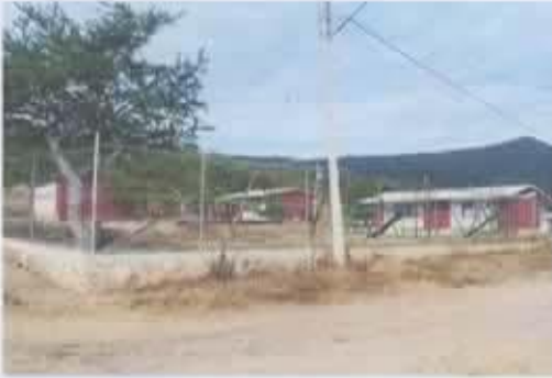
Ilustración 2 ESCUELA PREESCOLAR