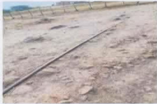
Ilustración 1 AGUA POTABLE