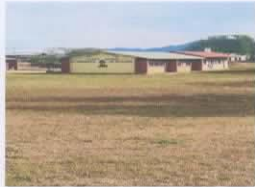
Ilustración 4 ESCUELA PRIMARIA