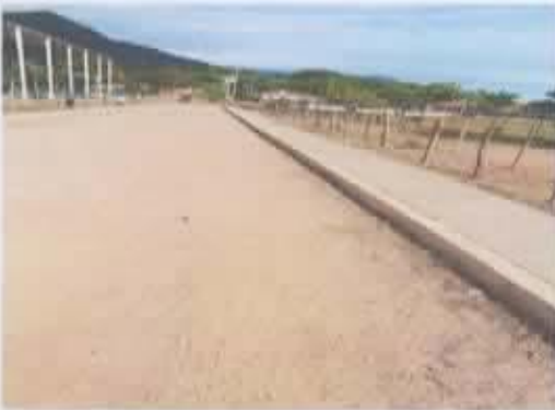
Ilustración 6 EMPEDRADO