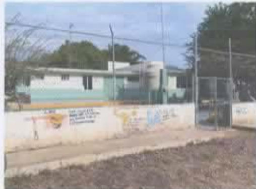
Ilustración 5 CLINICA