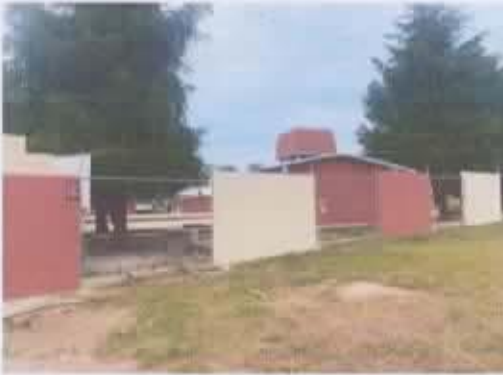
Ilustración 2 ESCUELA SECUNDARIA