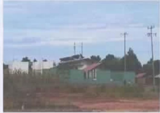
Ilustración 1 CLINICA