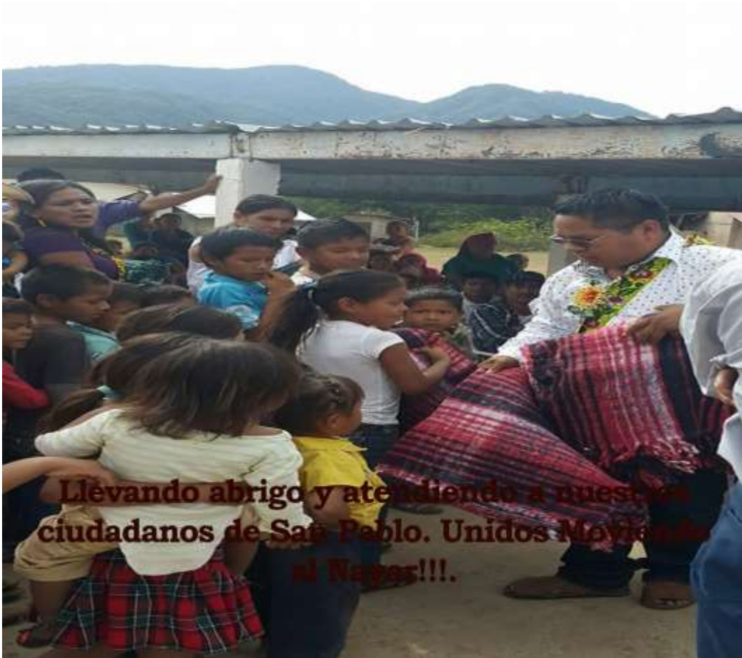
Llevando abrigo y atendiendo a nuestros ciudadanos de San Pablo. Unidos Moviendo al Nayar!!!.